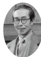
岸田國士 KISHIDA KUNIO [1890～1954]